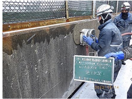
② コンクリート表面処理