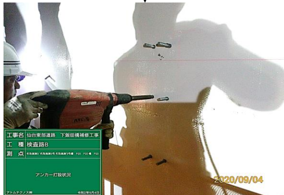
③ アンカー打設状況