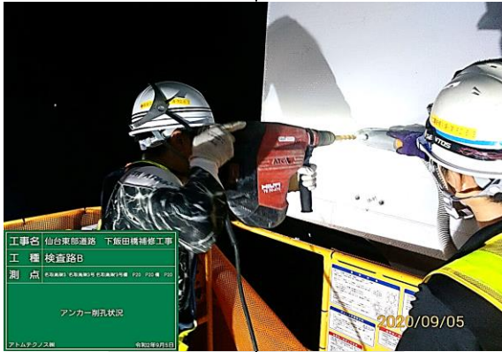
② アンカー削孔状況