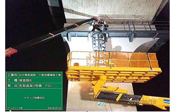
⑦ タラップ設置状況