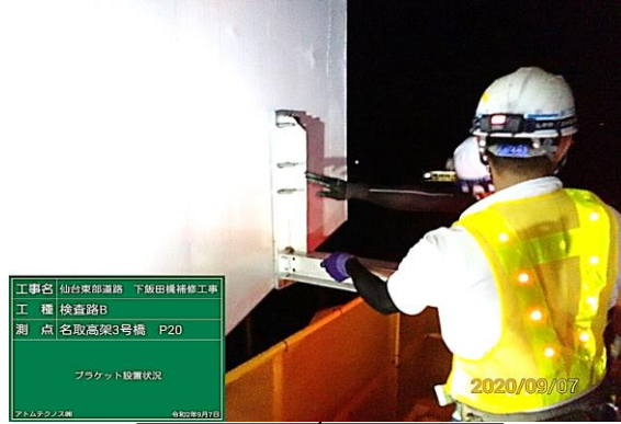
④ ブラケット設置状況