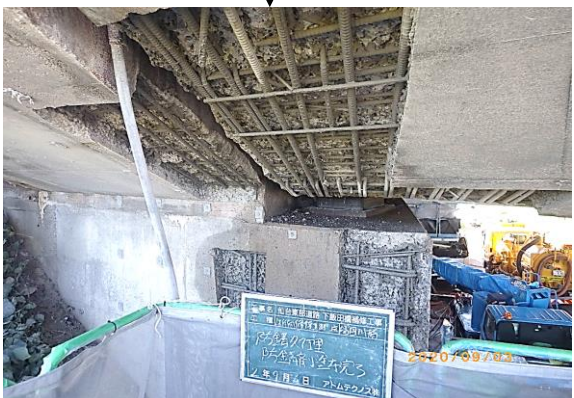
⑤ 鉄筋防錆材塗布完了