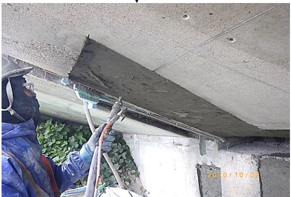
⑥ 断面修復材吹き付け状況