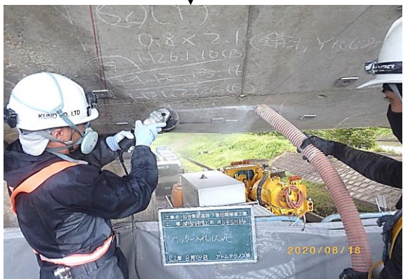
② カッター入れ状況