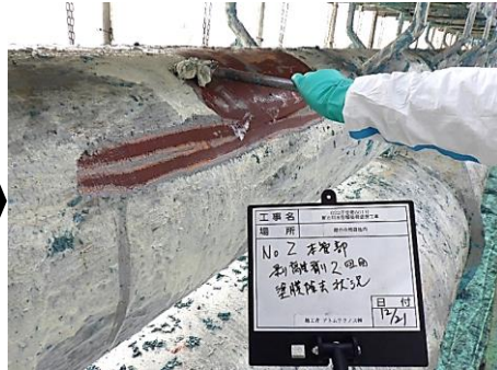
②塗膜除去工（剥離剤）