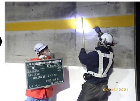
④ 視線誘導ライン幅210mm