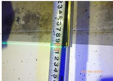
② 塗装高さ2 (接写) 1000mm