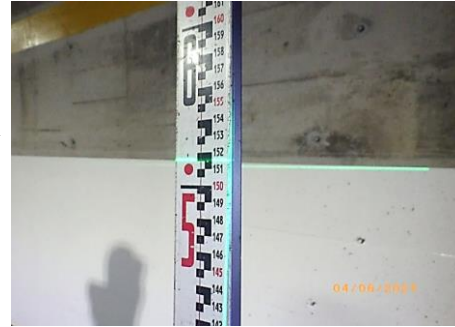
① 塗装高さ1 (接写) 1515mm