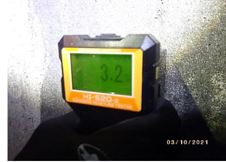
③コンクリート表面含水率