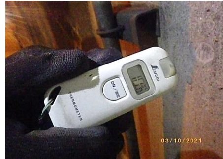
②コンクリート表面温度