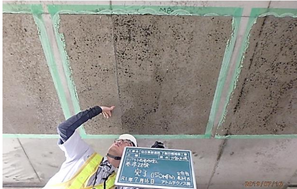
① コンクリート表面処理工 基準試験