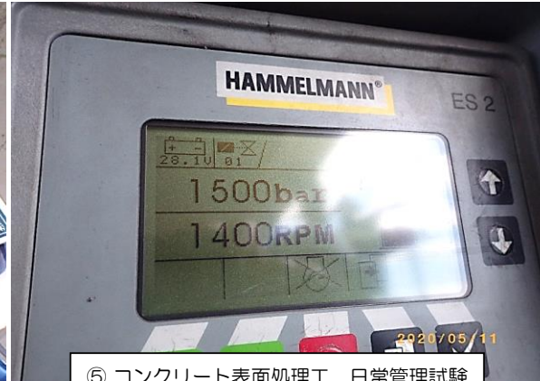
⑤ コンクリート表面処理工 日常管理試験