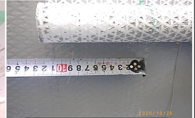
⑦ 連続繊維シート接着工 日常管理試験