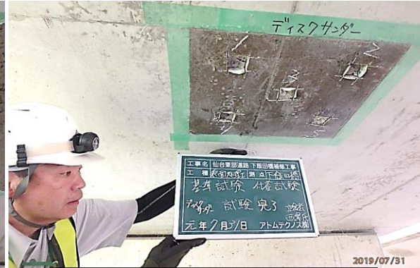
④ コンクリート表面処理工 基準試験