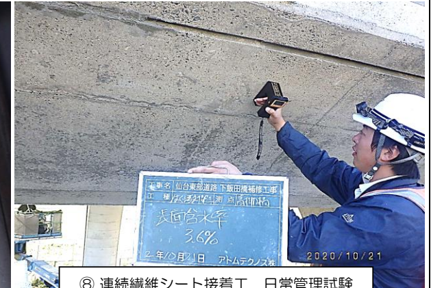
⑧ 連続繊維シート接着工 日常管理試験