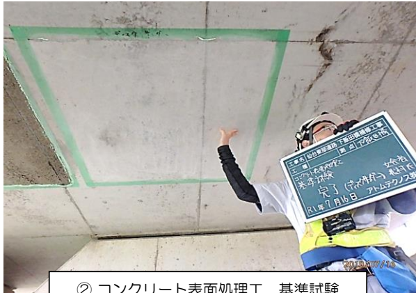
② コンクリート表面処理工 基準試験