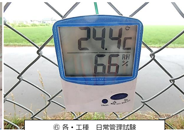
⑥ 各・工種 日常管理試験