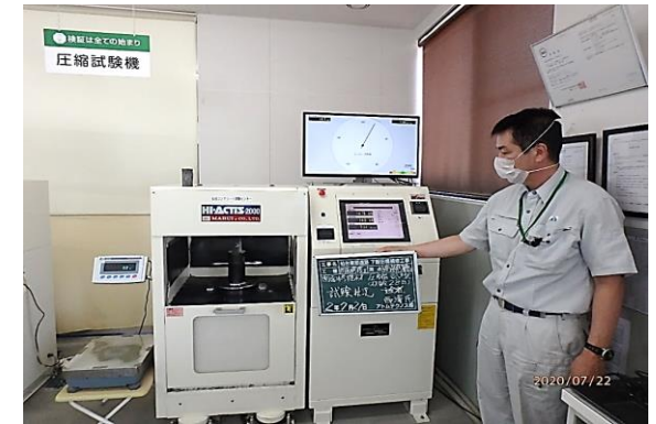
⑤ 断面修復定期管理試験(圧縮) 試験前