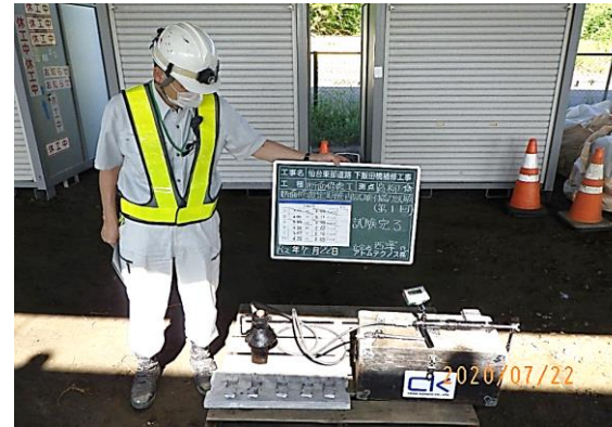
④ 断面修復定期管理試験(付着) 試験後