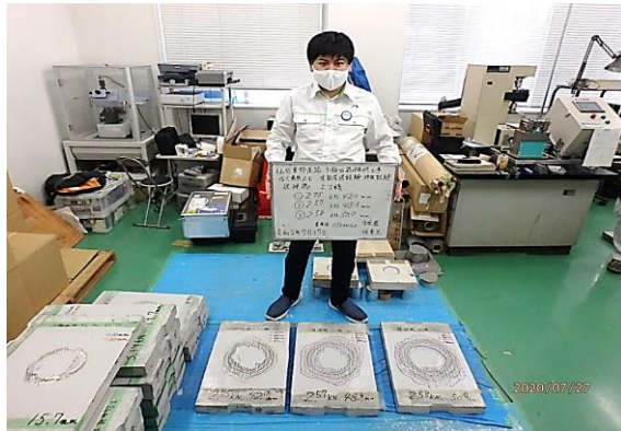
② はく落性能定期管理試験(押抜) 試験後