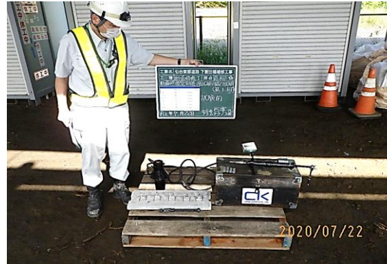
③ 断面修復定期管理試験(付着) 試験前