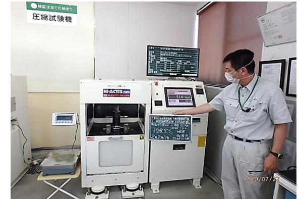
⑥ 断面修復定期管理試験(圧縮) 試験後